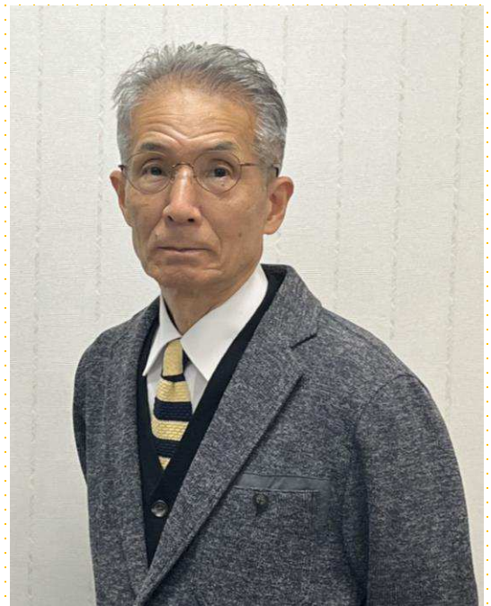
MHC代表理事 関西福祉科学大学名誉教授